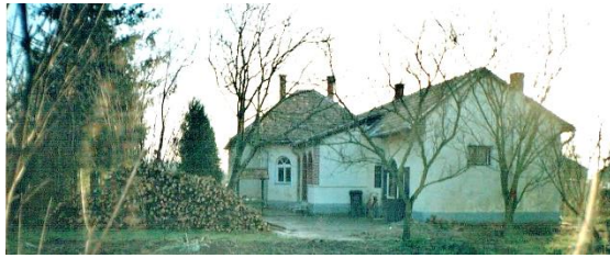
Hongarije. Ons FamilyCareHouse in Hongarije.

ontwikkelingsproject in PapuaGuinee. Dat is een heel vruchtbare onderneming geweest en evenzo een mooi getuigenis en vrucht van jarenlange zorg voor deze familie.